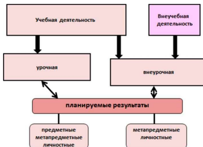
Рис. 1. Схема организации коррекционной работы в МОБУ СОШ с. Большая Ока

Коррекционная работа в обязательной части (70 %) реализуется в учебной урочной деятельности при освоении содержания образовательной программы. На каждом уроке учитель-предметник ставит и решает коррекционно-развивающие задачи. Содержание учебного материала отбирается и адаптируется с учетом особых образовательных потребностей обучающихся с ограниченными возможностями здоровья. Освоение учебного материала этими школьниками осуществляется с помощью специальных методов и приемов.